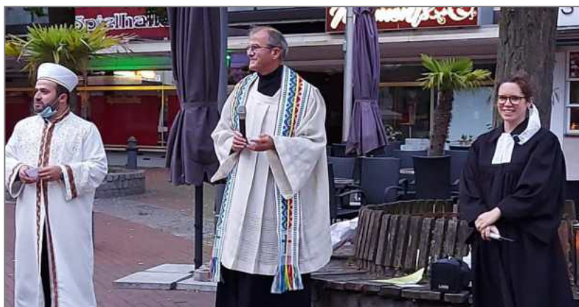
Friedensgebet auf dem Marktplatz