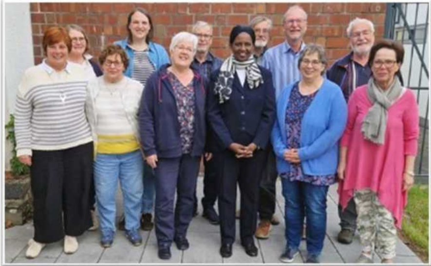
Die Mitglieder beider Ausschüsse für Ökumene trafen sich zu einer gemeinsamen Sitzung.